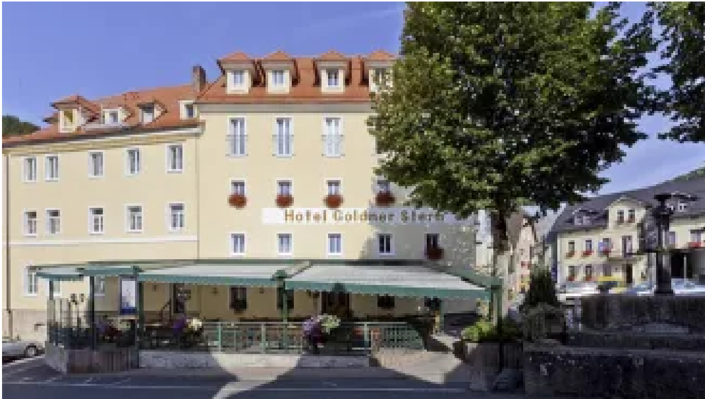
Hotel Goldner Stern 🏠