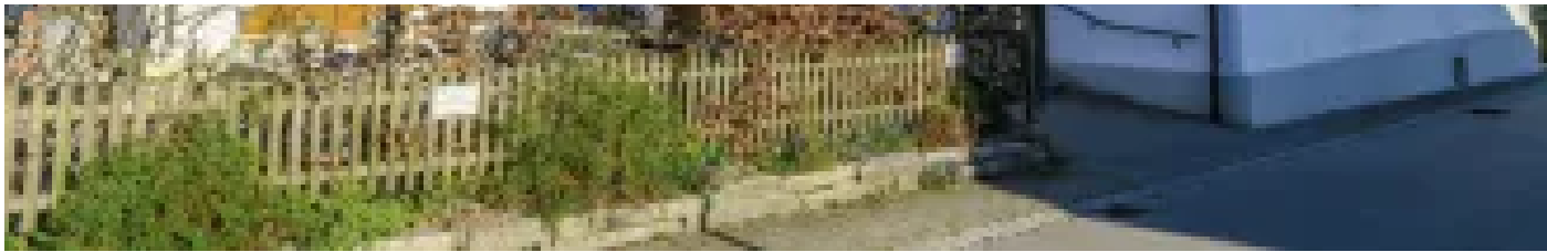
Landgasthof Sonne Dorfstraße 7 87675 Stötten am Auerberg