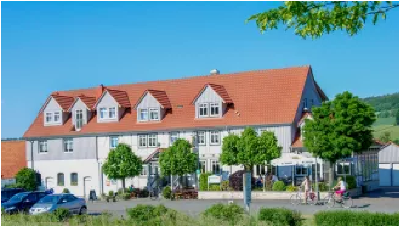
Gasthaus Zum Lindenwirt Weißhütte 14 34399 Wesertal